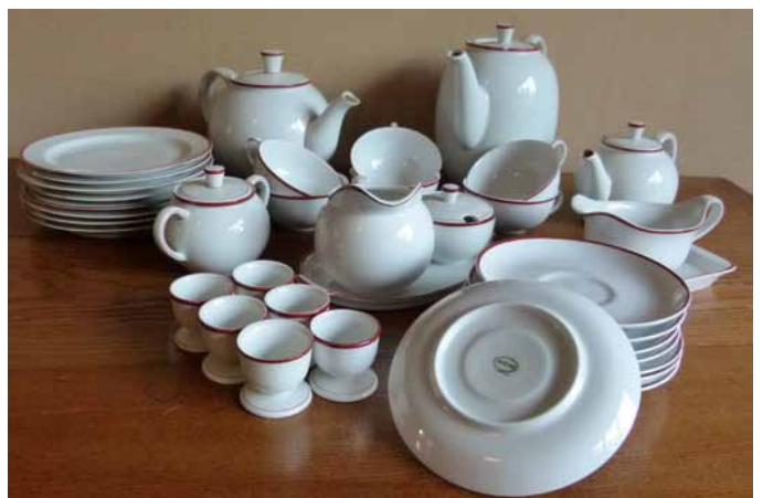
In Reih und Glied: Das Gretsch-Geschirr

Porzellan der Form Arzberg 1832 aus den Anfängen der Produktion findet sich auch im Besitz der ernst-may-gesellschaft. Im September ist es unser Ausstellungsobjekt des Monats. Am 29. September erfahren Sie in einer Sonderführung mehr zu den Hintergründen der Entstehung und seines Erfolges. (ig)