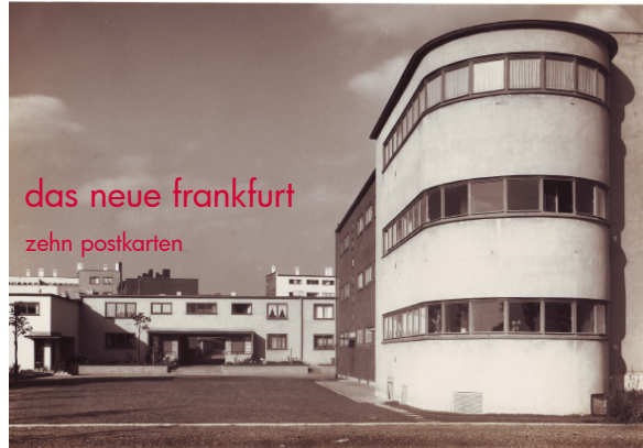
Römerstadt historisch: das Deckblatt der klassischen Postkartenserie ziert der Blick auf das ernst-may-haus, eine der Postkarten die Siedlung Höhenblick um 1930 (mitte rechts).