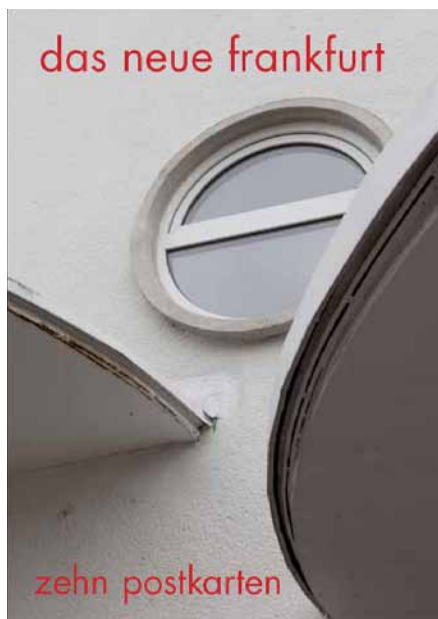
Neues Frankfurt aktuell: Der Umschlag der modernen Postkartenserie zeigt ein Detail des Kopfbaus in der Hadrianstraße (links), eine der Postkarten das Budget-Altenheim (rechts).