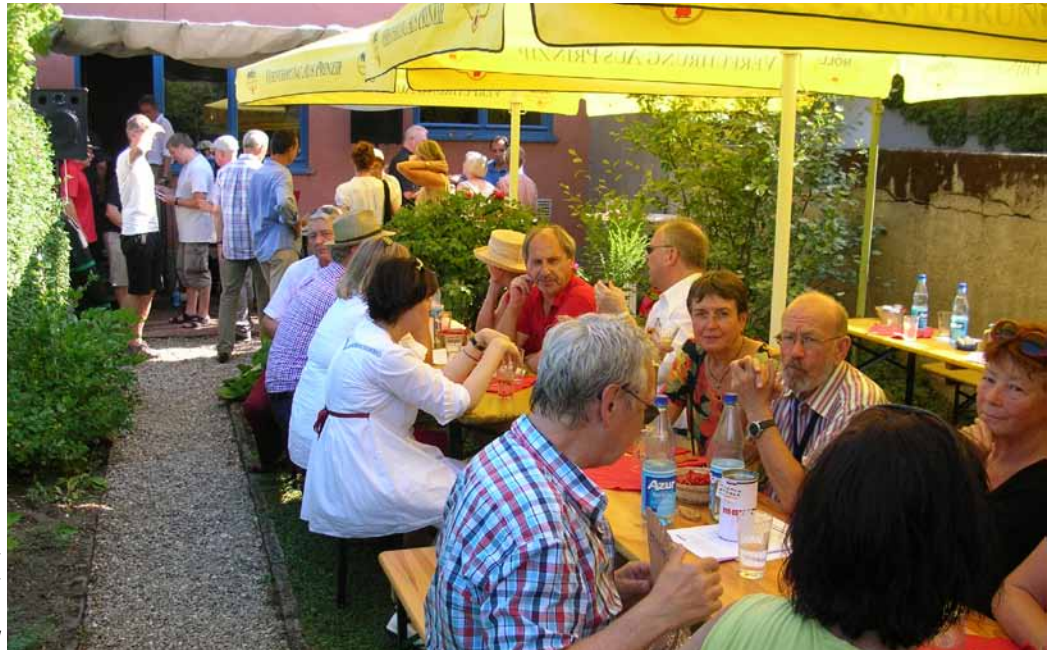
Die meisten Besucher suchten Schutz unter den Sonnenschirmen

Trotz Rekordtemperaturen fanden viele Menschen zur Feier eines runden und eines unrunder Geburtstags den Weg in die Römerstadt