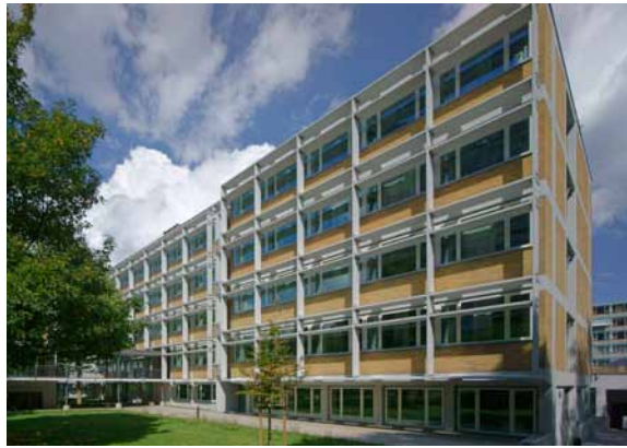
Die Südfassade mit den charakteristischen ‚Brise-soleils‘