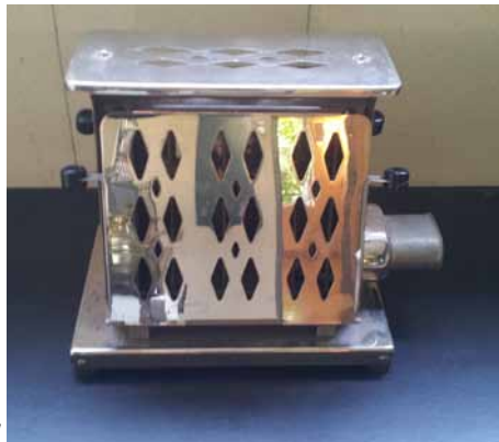
Technische Innovation in expressionistischem Design: elektrischer AEG-Toaster aus den 1920er Jahren

warb er vollmundig mit dem Verweis auf die Ausrüstung einer für den Dauerbetrieb angelegten Großküche. Die listigen Werbetexter verschwiegen allerdings, dass diese Küche im Normalfall mit Gas und nur in Ausnahmefällen elektrisch betrieben wurde.